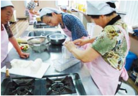
お弁当作りの様子

でもやはり町としてサービス内容を統一したいということ、さらには最低でも毎週1回は利用者の生活状況を確認出来る、というメリットを考えると、ボランティアの人数をそろえることも大切なことでした。お