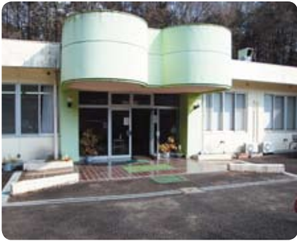
桂老人福祉センター

利用料金400円(町内60歳以上の場合)、これを利用者は部屋、風呂、カラオケなど施設内の設備を自由に利用できます。飲食物