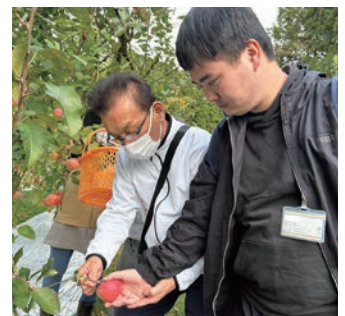
甘いリンゴがとれました

リンゴ狩りは、今年も佐 川果樹園さんに行つてきま した。リンゴの採り方は、 ツルに指をあてて、リンゴ の実を下から上に回転させ ると上手く採れるそうで す。数種類のリンゴの木か ら赤くて美味しそうなリン