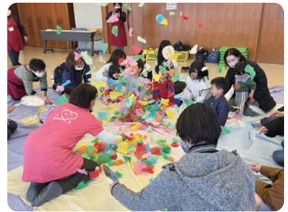
うちわでパタパタ~!

まず最初に皆で大きな輪 になって座り「手のひらを太 陽に」の音楽に合わせて、手 たたいたり、手をつないだり しました。次に2人組になり 向き合い、リズムに合わせて