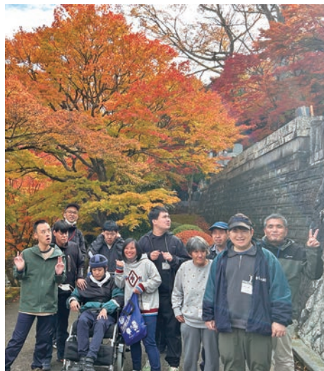
きれいな紅葉をバックに

リンゴ狩りの後は、常陸 大子駅近くにある、永源寺 へ紅葉を見に行きました。 真っ赤に色づく紅葉はとて もきれいで、観光客で賑 わっていました。つくしの