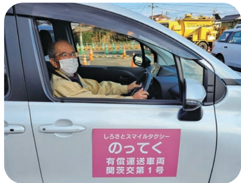
安全運転で行ってきます

更に八ツ頭も育てていますが、種芋を保存するのが難しいのです。一度、穴を掘って保存しましたが失敗し、今回は保存方法を教室で教えて頂いたので春が楽しみです、と話されていました。5月に種芋より新たな芽が出ていることを願っております。